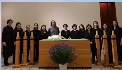
Schola Gregoriana Seoulensis