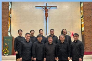
Cantores Gregoriani Seoulensis