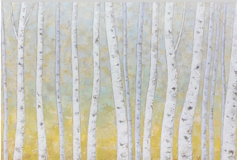
Spiritus Arboris , Kyoo-Ho Cho, *1975, 2021.